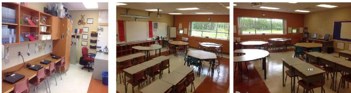
Figure 4 : la classe-atelier, ses ressources informatiques, ses îlots

Luc : Adapter son environnement à son activité est un idéal qu'il n'est pas toujours possible de réaliser. Par exemple, faire de la CI en grands effectifs dans le cadre contraint d'un CM en amphi, nécessite au contraire de bien adapter l'activité à son environnement imposé : l'enseignant doit développer des trésors d'imagination pour faire animer un amphi et le rendre interactif ! Le boîtier de vote devient alors un outil intéressant : tester l'acquisition des concepts qui étaient à étudier en travail préparatoire via un QCM autour des points que le professeur a identifiés comme posant problème est un très bon préambule qui permet de capter l'attention à chaque question et de visualiser le taux de compréhension en revenant plusieurs fois sur le même concept (avant et aussi après l'explication complémentaire). Le côté rigide de l'amphi n'empêche pas de mettre en place des groupes d'élèves géographiquement proches pour qu'ils se concertent sur l'élaboration d'un problème basé sur le cours du jour et qu'ils puissent ensuite désigner un rapporteur pour venir poser le problème aux autres équipes... même en environnement contraint on peut imaginer des activités qui nécessitent une participation active des élèves.